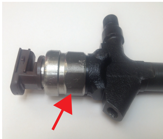
Uszkodzona nakrętka cewki. Nosi znamiona próby odkręcania