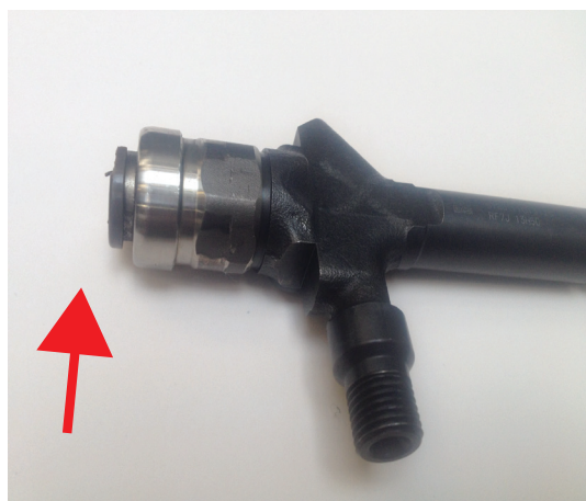
Brak cewki - wtryskiwacz uszkodzony mechanicznie